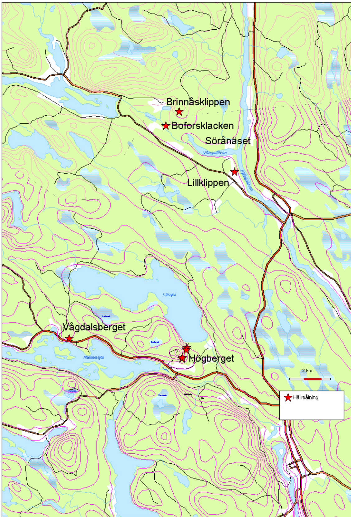
Översiktskarta. Hällmålningarna nämnda i rapporten. De på Brinnåsklippen och Boforsklacken är ej utsatta med koordinatuppgifter. Karta: Lennart Forsberg, KMV AB