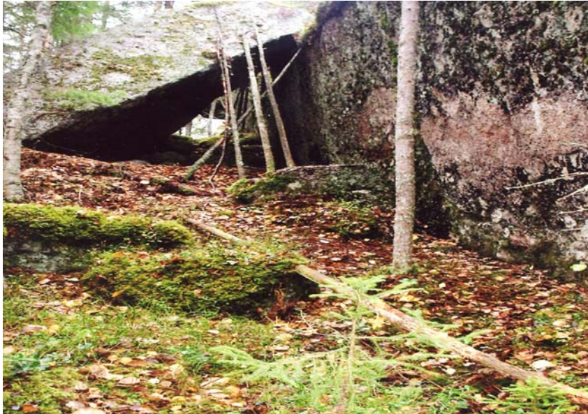
Bild 1. Rakt fram ser vi Bakugnen (Raä 38) och det takade rummet. Lägga märke till den av alg, lav och mossa beväxta hållen till höger i bilden. Det parti vilket skonsamt befriades från detta syns som ett närmast vågrätt fält. Hällmålningen kan anas till höger om trädstammen.