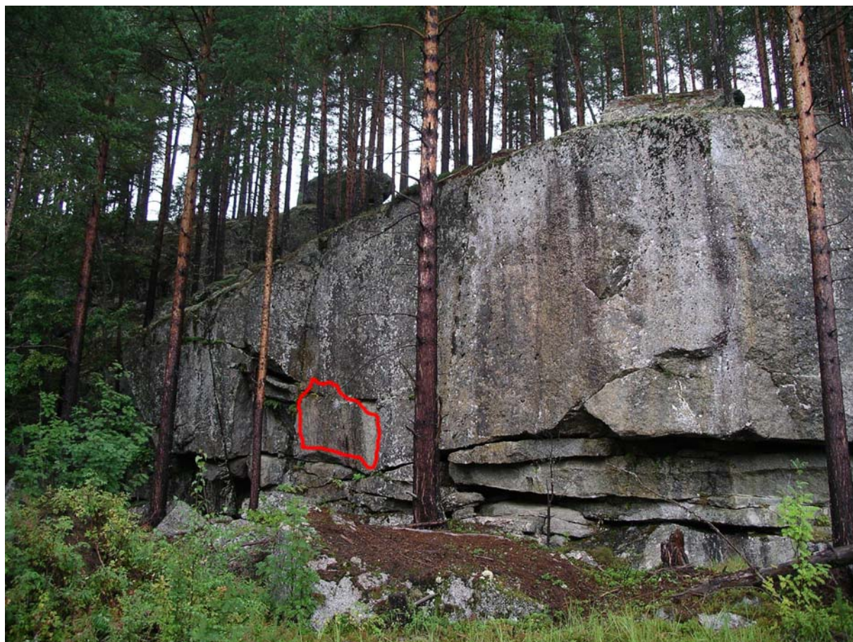
Bild 1. Platsen för hällmålningen på Vågdalsberget i Ramsele socken.

Bernt Ove Viklund, Härnösand, februari 2004 Forntid i Ramsele och Kulturmiljövårdarna AB i Härnösand